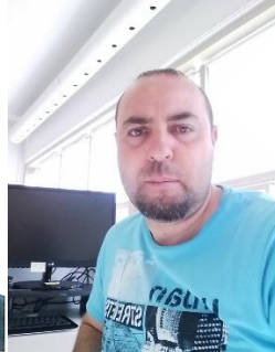
M Farid Mouloudj